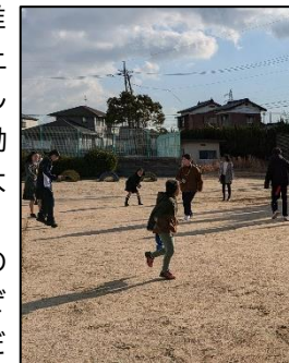
(学童保育ボランティアの様子)

慶進高校では、地域社会における課題を設定し、地域との連携・協働により問題解決のプロセスを体験的に学ぶ探究型学習を推進するため、「地域連携教育推進委員会」を立ち上げ、様々な活動を行っています。その活動の一つとして、地域のボランティアや職業体験などの校外活動を全生徒に紹介し、自主的な参加を促しています。大学に提出する志望理由書や活動報告書を書く時や、大学入試の面接試験の際には、これら校外活動への参加実績をアピールポイントとして活用できます。ぜひ、様々な活動にフットワーク良く、取り組んでください。たくさんの生徒の参加を待っています！